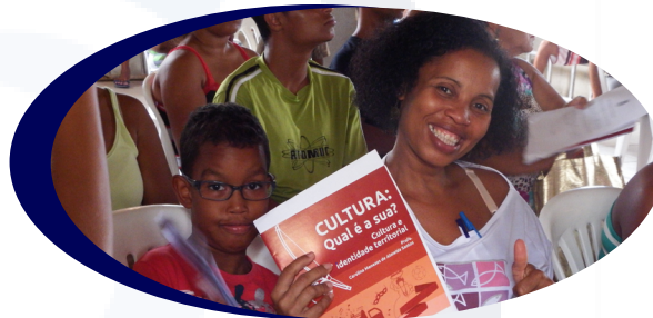
PROJETO: MINHA CASA, NOSSAS VIDAS COORDENADORA: TÂNIA FISHER